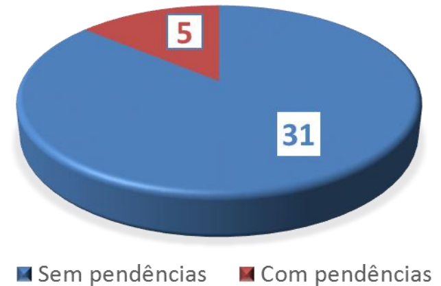
Amostragem: Nº de Estabelecimentos por Estado